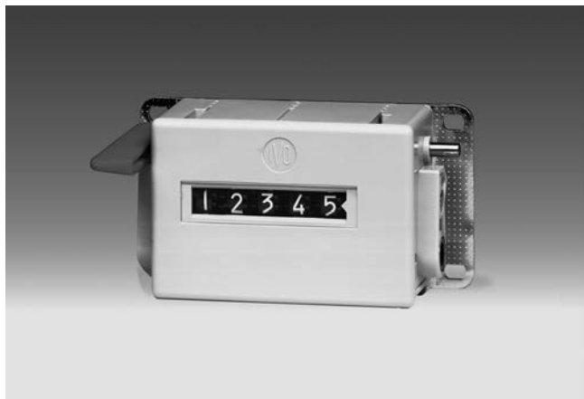
U 411 - Umdrehungszähler