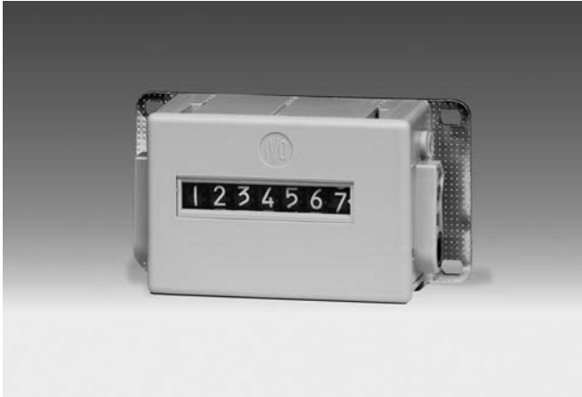
U 401 - Compteur de tours