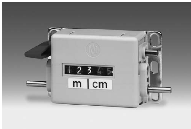
M 310.A - PTB-Meterzähler